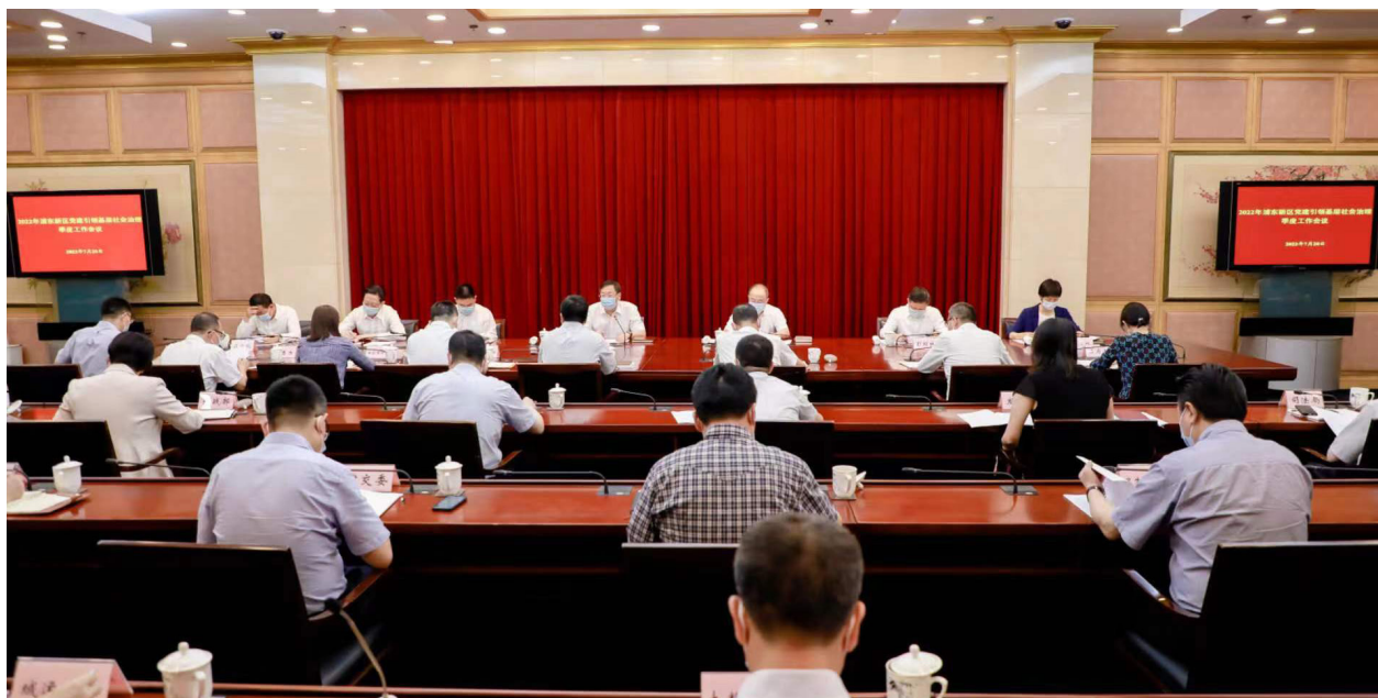
▲ 2022年7月20日浦东新区召开党建引领基层社会治理季度工作会议

2022年7月20日下午，市委常委、区委书记朱芝松同志出席党建引领基层社会治理季度工作会议并作重要讲话。区委副书记单少军同志出席并讲话。区委常委、政法委书记张磊，区委常委、组织部部长彭琼林，副区长马雪波、左轶梅、吕雪城同志作工作部署。